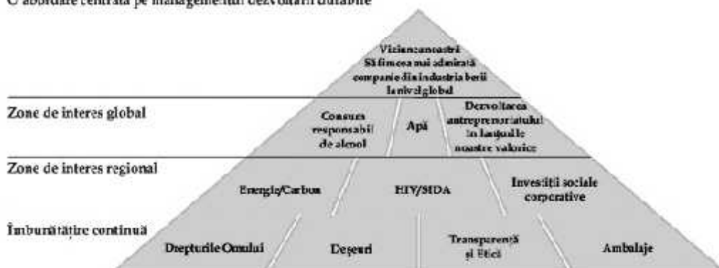
Figura 3. Priorități de dezvoltare durabilă

Abordare centrată pe managementul dezvoltării durabile