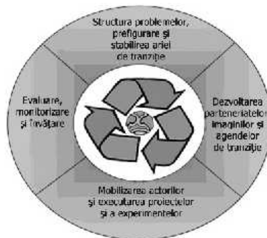
Figura 2. Cadrul de gestionare a tranziției organizaționale

Pentru instaurarea unei culturi a sustenabilității, ar fi nevoie de o schimbare fundamentală în gândire cu privire la procesul de dezvoltare socială și în consecință, o schimbare fundamentală în modul în care acest proces este organizat. În plus, dezvoltarea durabilă este mai mult decât o necesitate, este o obligație a generațiilor prezente pentru a asigura un viitor generațiilor ce vor urma, atât din punct de vedere ecologic, cât și social și economic (Lamberts, 2007).