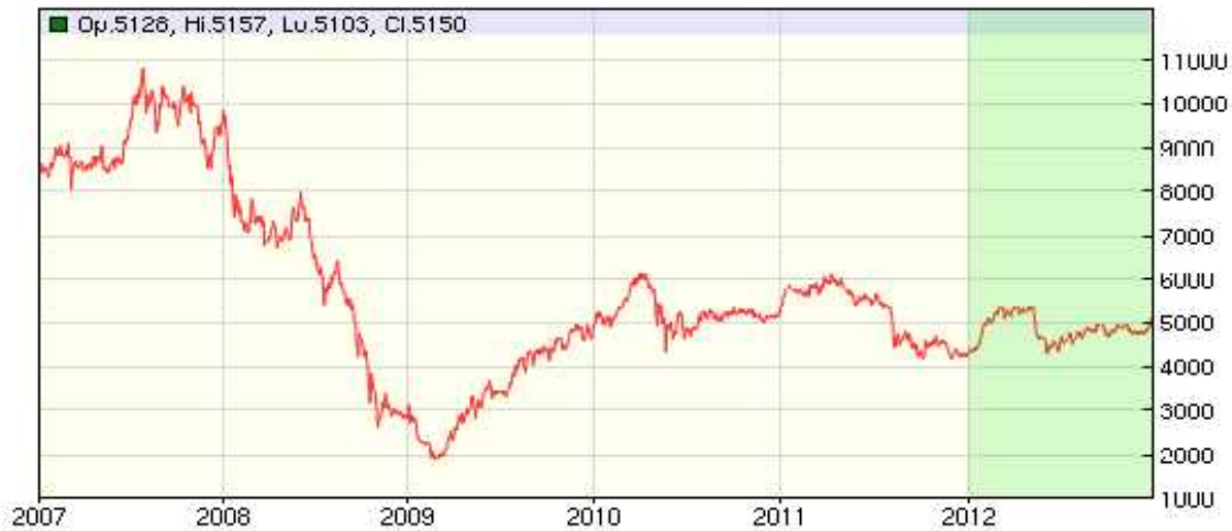
Fig. nr. 1 Evoluția indicelui BET în perioada 2007 - 2012