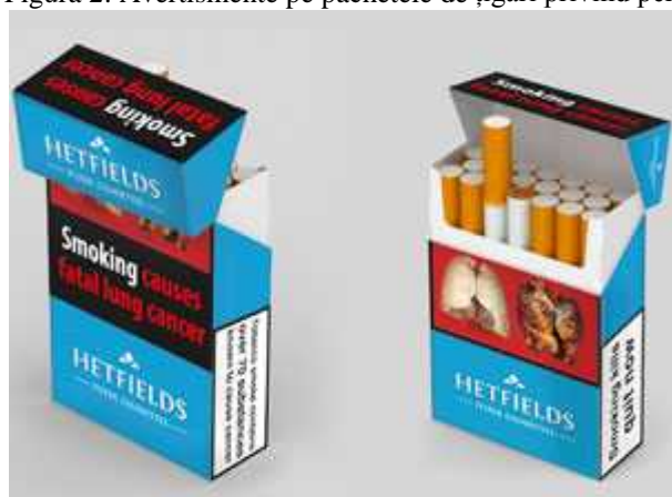
Figura 2: Avertismente pe pachetele de țigări privind pericolul fumatului